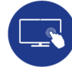
Ecran tactile détachable