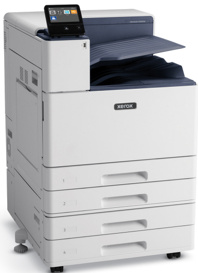
VersaLink® C8000W plus module à deux magasins